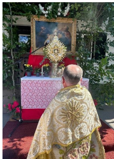
Bild: Fronleichnam in Oberstdorf 2025